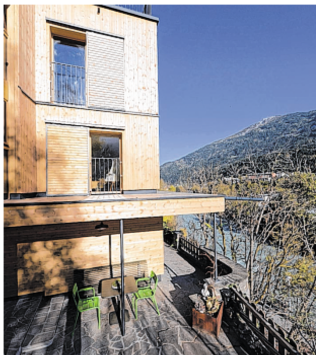
Ein Beispiel für nachhaltiges Wohnen und Leben zeigt die Familie Steinlechner vor.

Schnell war klar, die Sanierung soll auch eine Umstrukturierung werden. Trotzdem sollten Teile des Altbaus erhalten bleiben. Vor allem die von den Großeltern der Bauherrin in ca. drei Jahren Handarbeit geschaffenen Natursteinmauern stellten ein besonderes Element des Altbestands dar. Entsprechend war es auch der Wunsch der Bauherren, diese in ih-