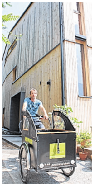
Alltagsgeschäfte werden mit dem E-Lastenrad erledigt.